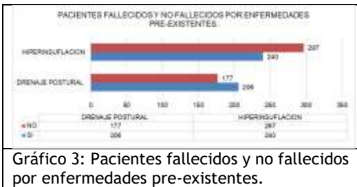
Gráfico 3: Pacientes fallecidos y no fallecidos por enfermedades pre-existentes.

hiperinsuflación manual y aspiración de secreciones para el paciente intubado con el resto de las técnicas existe aún controversia.